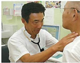
昨年からはめた人間ドックの診察場面

父親から息子へ襷をつないだ一例として、黒田官兵衛と長政親子があげられます。織田信長、豊臣秀吉、徳川家康の乱世の時代を生き抜いた黒田官兵衛と息子の長政の性格は全く違っていましたが、父の官兵衛は謀り事、息子に長けた策略家である一方、息子の長政は常に正々堂々と正面から敵にぶつかっていくタイプでした。このため、官兵衛は人に恐れられましたが、長